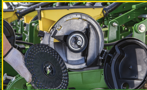
Dosador de Sementes MaxEmerge5™.