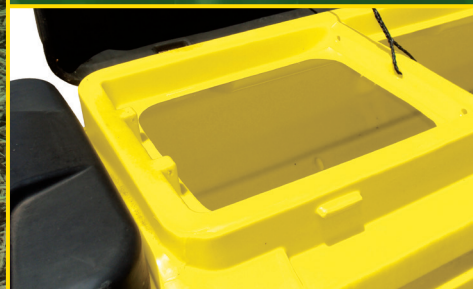
Caixa de Fertilizante para mais de 200 kg/linha.