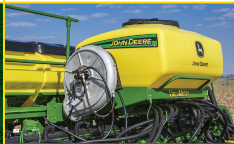
CCS: padrão em toda a Série 2100.