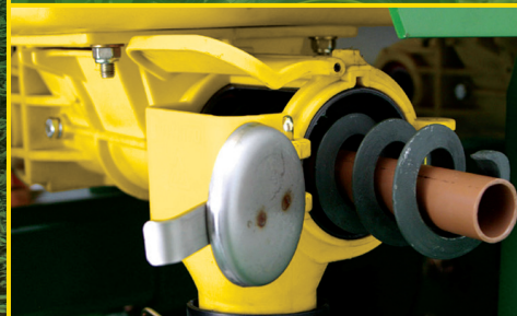
Dosador de Fertilizante ProMeter™.