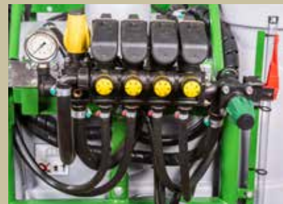
COMANDO ELÉTRICO DE 4 VIAS