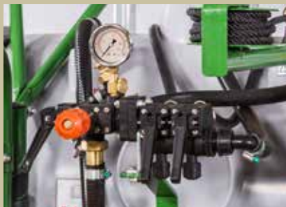
MASTER MANUAL DE 2 OU 4 VIAS