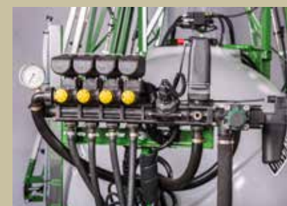
COMANDO ELETRÔNICO DE 4 VIAS