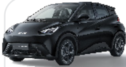
POLAR NIGHT BLACK